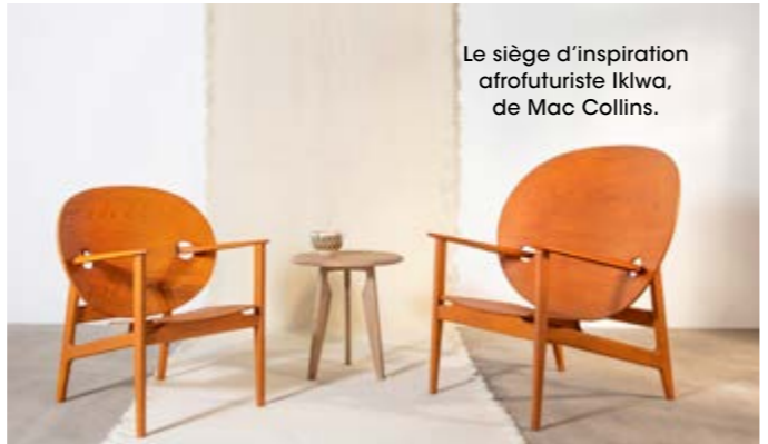
Le siège d'inspiration afrofuturiste Iklwa, de Mac Collins.